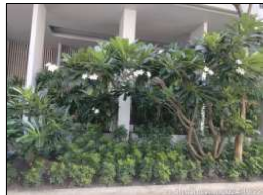
รูปที่ 1-11 (ต่อ) พื้นที่สีเขียว และพื้นที่นันทนาการของโครงการ