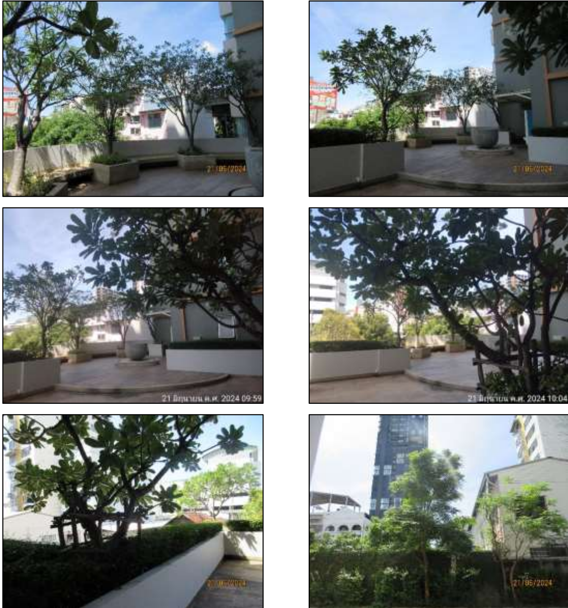
รูปที่ 1-11 พื้นที่สีเขียว และพื้นที่นันทนาการของโครงการ

พื้นที่สีเขียวและพื้นที่สำหรับพักผ่อนนันทนาการของโครงการ เป็นพื้นที่ส่วนกลาง ที่ผู้พักอาศัยสามารถเข้าไปใช้ประโยชน์ในการพักผ่อน ผ่อนคลาย ออกกำลังกาย บริเวณสวนหย่อม และต้นไม้บริเวณรอบๆ โครงการได้ ดังแสดงในรูปที่ 1-11