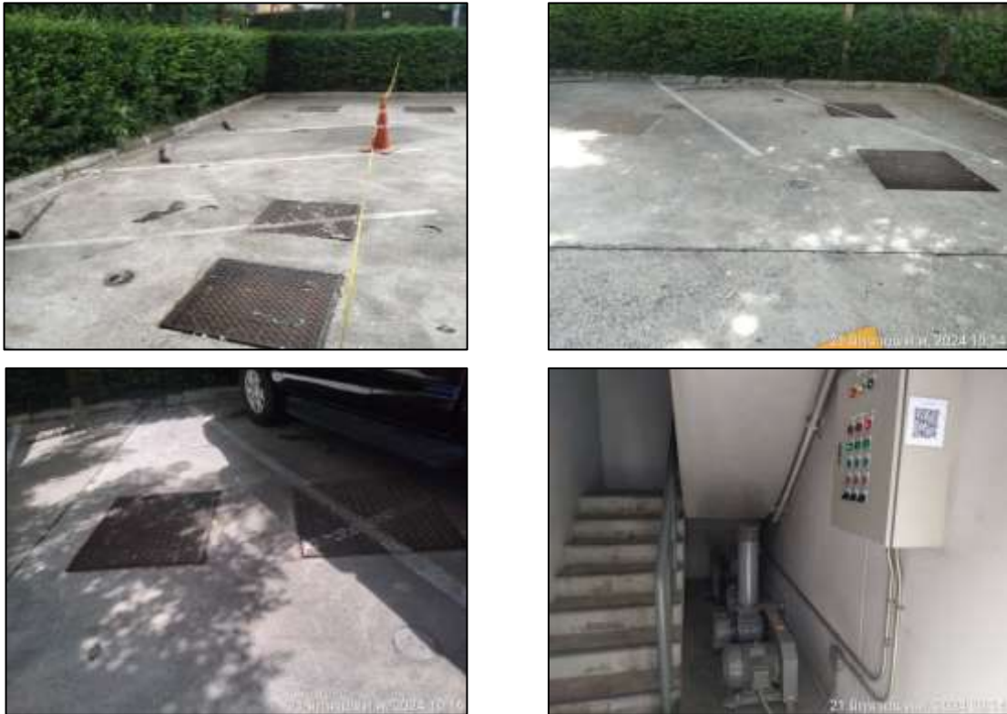
รูปที่ 1-7 ระบบบำบัดน้ำเสียของโครงการ

โครงการออกแบบให้มีระบบบำบัดน้ำเสียรวม จำนวน 1 ชุด รองรับน้ำเสียจากกิจกรรมต่างๆ ที่เกิดขึ้นจากโครงการ เข้าระบบบำบัดน้ำเสียรวมแบบ Fixed Film Aeration Process ก่อนระบายออกสู่ภายนอกโครงการ ดังแสดงในรูปที่ 1-7