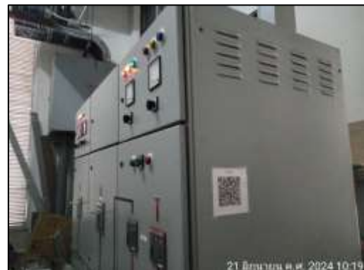
รูปที่ 1-6 เครื่องกำเนิดไฟฟ้า