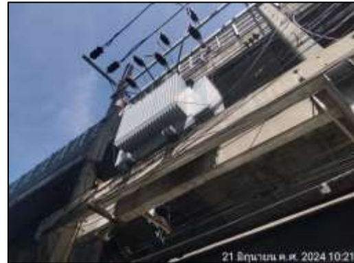
รูปที่ 1-5 หม้อแปลงไฟฟ้า

2) ระบบไฟฟ้าสำรอง โครงการใช้ระบบไฟฟ้าสำรองจะเป็นเครื่องกำเนิดไฟฟ้า จำนวน 1 ชุดโดยการติดตั้งภายในห้อง GEN บริเวณชั้นที่ 1 ของอาคาร ดังแสดงในรูปที่ 1-6