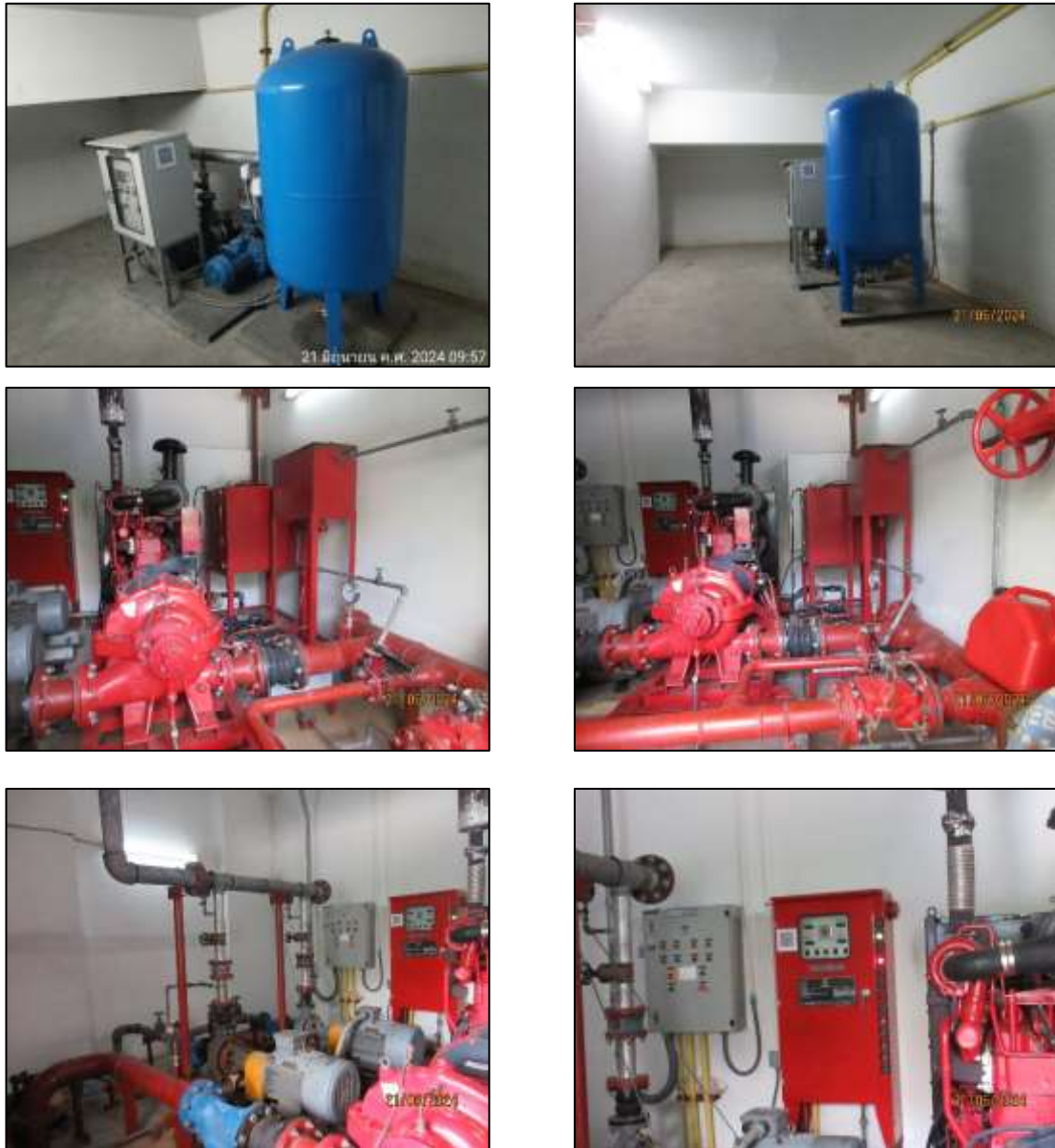
รูปที่ 1-4 ระบบจ่ายน้ำของโครงการ

2) ระบบจ่ายน้ำโครงการได้ติดตั้งระบบปั้มน้ำ 2 ระบบ คือ ระบบจ่ายน้ำใช้ทั่วไป โดยติดตั้งเครื่องสูบน้ำ เพื่อสูบน้ำจากถังสำรองน้ำของโครงการจ่ายไปยังส่วนต่างๆของอาคาร และระบบจ่ายน้ำดับเพลิง โดยติดตั้งเครื่องสูบน้ำดับเพลิง (Fire pump) จำนวน 1 ชุด ติดตั้งไว้บริเวณห้อง Fire pump เพื่อทำหน้าที่สูบน้ำจากถังเก็บน้ำดับเพลิงจ่ายไปยังหัวจ่ายน้ำดับเพลิง และระบบดับเพลิงของโครงการ ดังแสดงในรูปที่ 1-4