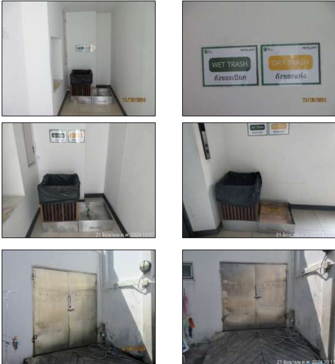
รูปที่ 1-9 ห้องพักขยะของโครงการ