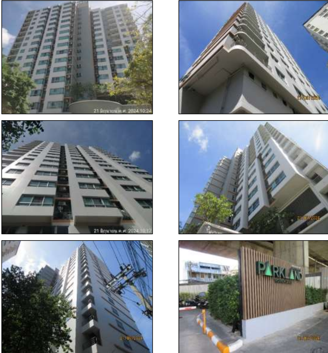
รูปที่ 1-2 สภาพปัจจุบันของโครงการ

ปัจจุบันโครงการอยู่ในช่วงเปิดดำเนินการ โดยโครงการได้รับใบอนุญาตก่อสร้างอาคาร ตัดแปลงอาคาร หรือรื้อถอนอาคาร (แบบ อ.1) ดังแสดงในภาคผนวก ก-4 และแสดงในรูปที่ 1-2