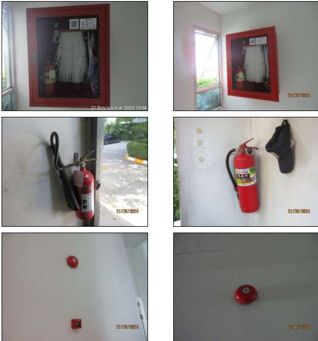
รูปที่ 1-10 ระบบป้องกัน และระงับอัคคีภัย

โครงการได้จัดให้มีการติดตั้งระบบป้องกันอัคคีภัย ตามตามที่ระบุไว้ในรายละเอียดโครงการให้เป็นไปตามกฎกระทรวงฉบับที่ 33 (2535), 39 (2537), 47 (2540), 50 (2540) และ 55 (2543) และข้อบัญญัติกรุงเทพมหานคร เรื่อง ควบคุมอาคาร พ.ศ. 2544 ดังแสดงในรูปที่ 1-10