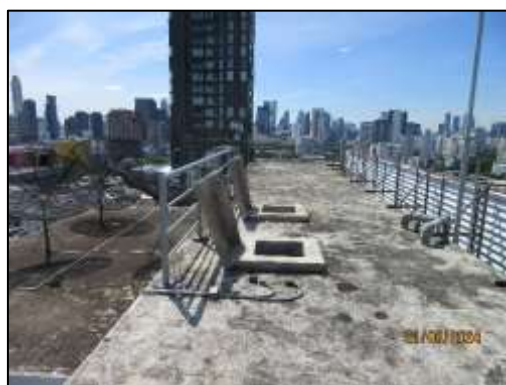
รูปที่ 1-3 ถังสำรองน้ำภายในโครงการ