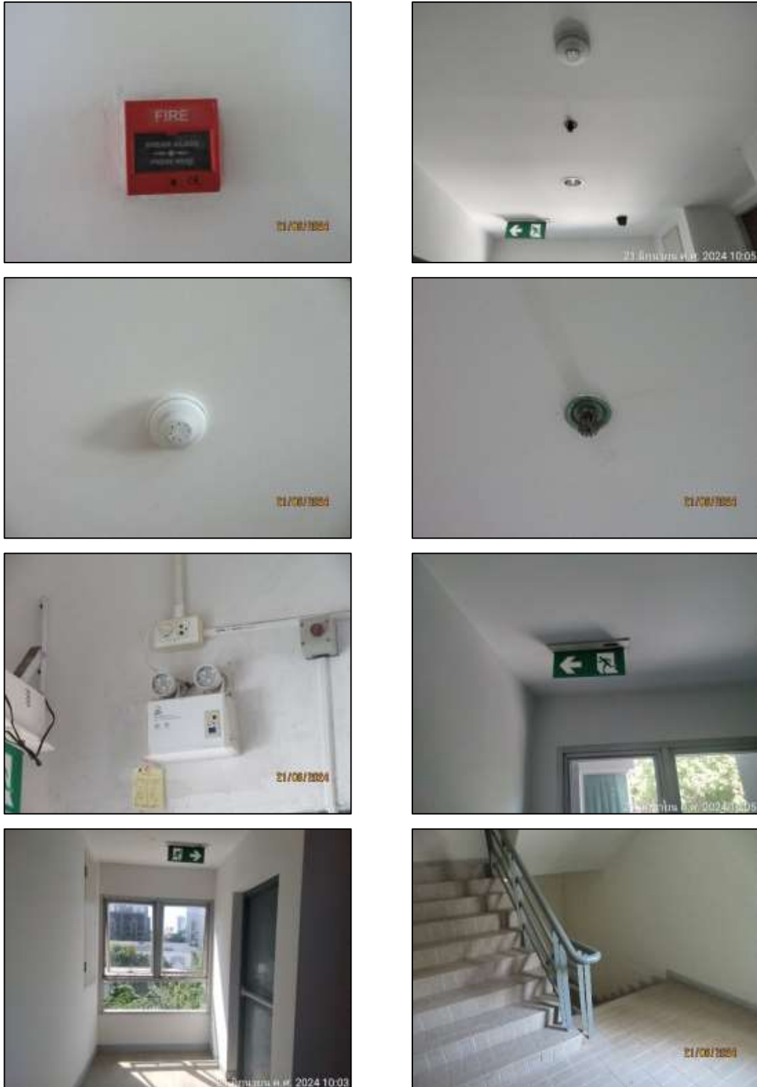
รูปที่ 1-9 (ต่อ) ระบบป้องกัน และระงับอัคคีภัย