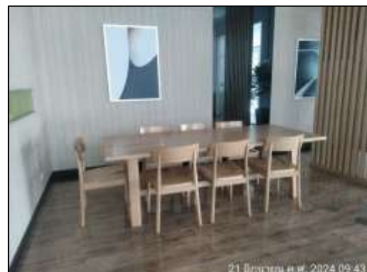
รูปที่ 1-11 (ต่อ) พื้นที่สีเขียว และพื้นที่นันทนาการของโครงการ