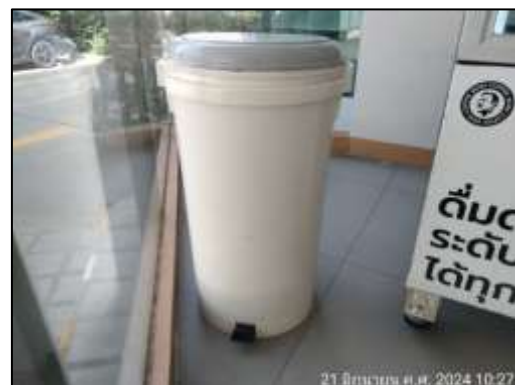
รูปที่ 1-8 ถึงขยะประจำโครงการ